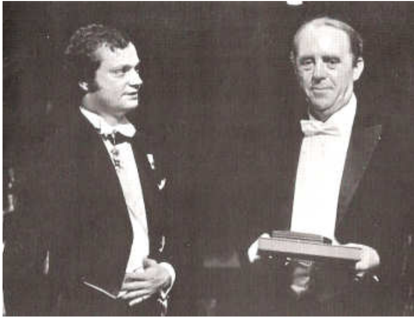
Carl Gustaf von Schweden vergibt Heinrich Böll den Nobelpreis (Stockholm, 1972)